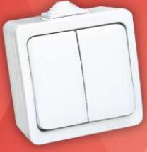
> 95 03