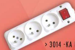
> 3014 -KA UPS