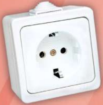
> 95 08