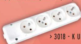
> 3018 -K UPS