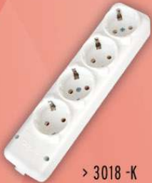
> 3018 -K