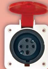
&gt; 2005 -MP