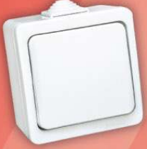
> 95 01