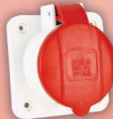
&gt; 2004 -MP