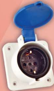
&gt; 2001 -MP