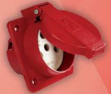
&gt; 1005 -MP