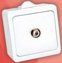
> 95 25