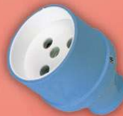
> 1005 -S