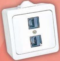
> 95 21 -D2