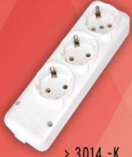
> 3014 -K

* Siyah renkli grup prizler istendiğinde isteğe bağlı olarak üretilmektedir.