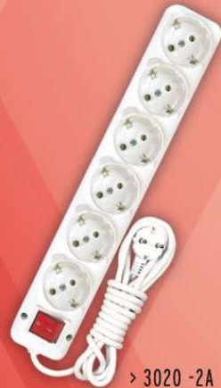
> 3020 -2A