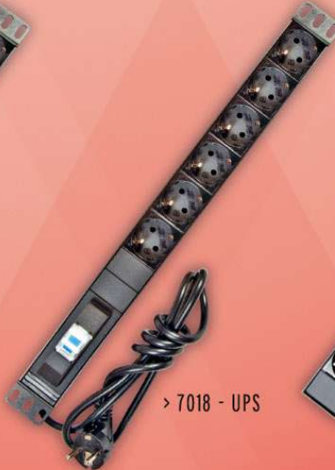
> 7018 - UPS