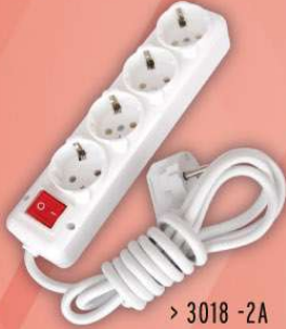
> 3018 -2A