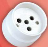
> 1005 -P