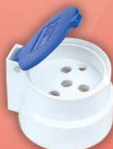
> 1005 -KP