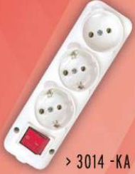
> 3014 -KA