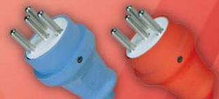
> 1005 -F