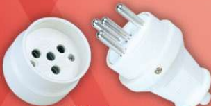
> 1005 -T